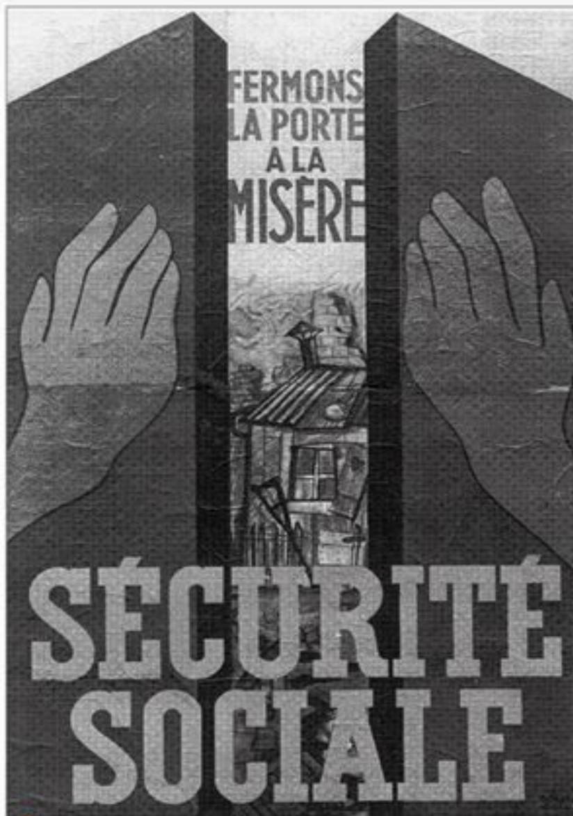
4 La création de la Sécurité sociale Affiche, 1945.