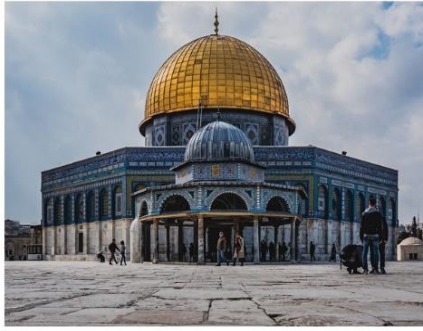
Doc 3 : Le dôme du Rocher