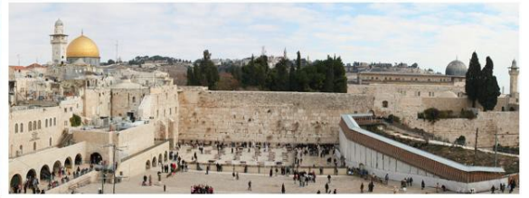
Doc 4 : Le mur des Lamentations