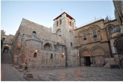
Doc 2 : La basilique Saint-Sépulcre à Jérusalem