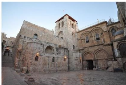
Doc 2 : La basilique Saint-Sépulcre à Jérusalem