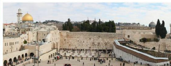
Doc 4 : Le mur des Lamentations