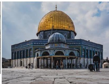
Doc 3 : Le dôme du Rocher