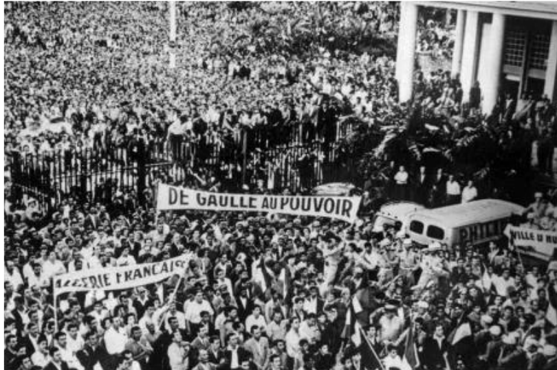
Document 1 : Photographie prise à Alger le 13 mai 1958. Alors qu'à Paris un nouveau gouvernement est formé par Pierre Pflimlin, les partisans de l'Algérie française manifestent violemment car ils craignent un abandon de la France.

Réponds aux questions portant sur les différents documents pour comprendre le retour du général De Gaulle au pouvoir.