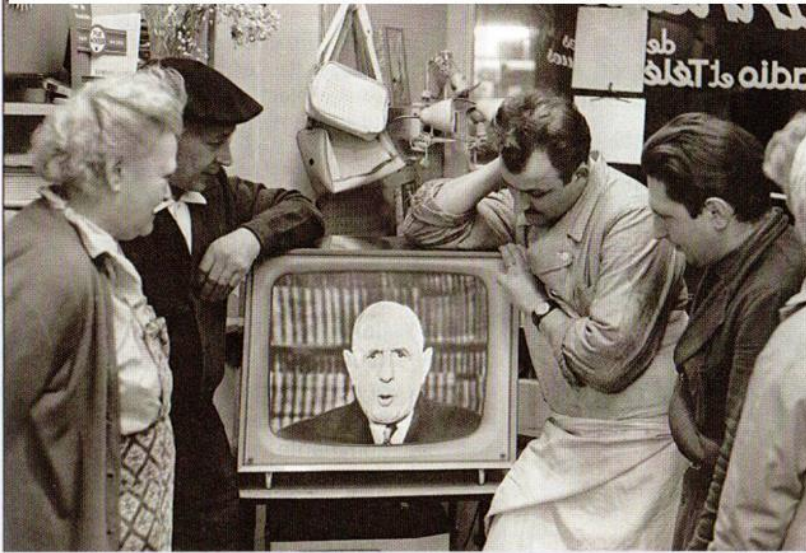
a. Une intervention télévisée dans les années 1960