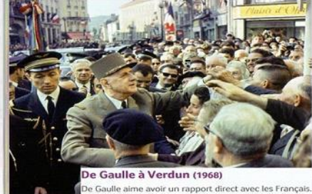
De Gaulle à Verdun (1968)

Charles de Gaulle. Mémoires d'espoir , Le Renouveau, Tome 1, Plon, 1970.