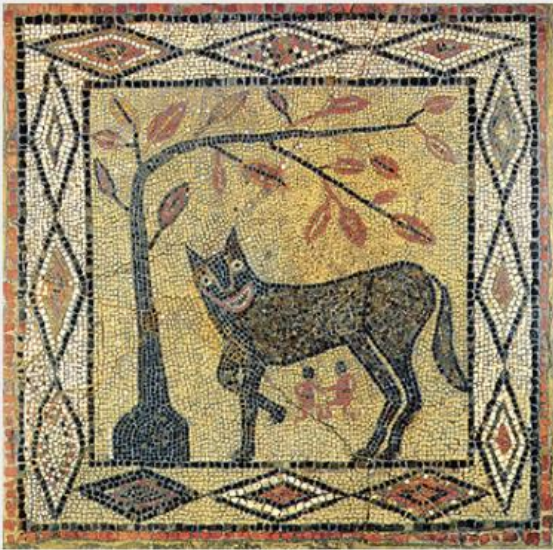
Mosaïque, vers 300 ap. J.-C., Leeds City Museum (Royaume-Uni).

Les Romains ne sont pas de grands inventeurs de légendes : leur imaginaire est tiré de la mythologie grecque. [...] Les seules légendes véritablement neuves concernent la fondation de Rome et de ses ascendants mythiques (Énée, Remus, Romulus). La légende d'Énée permet aux Romains de se rattacher aux épopées homériques. [...] Elle est fondatrice pour l'identité romaine : le citoyen est fier de faire partie d'une terre au passé légendaire. [...] La personnalité d'Énée permet de fixer les valeurs romaines : le dévouement à une cause, l'utilisation de la religion, le combat, le dépassement de soi et la certitude de faire partie d'une nation destinée à contrôler les autres. [...]