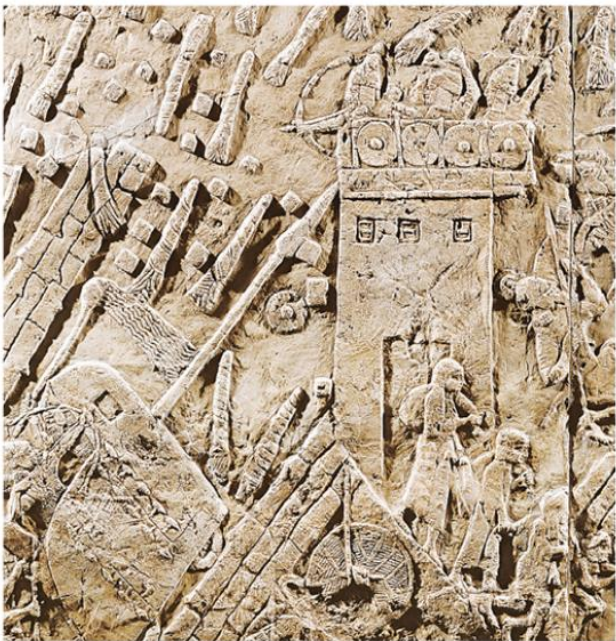
La bataille de Lakish, citadelle proche de Jérusalem, est mentionnée dans les archives du roi assyrien Salmanasar III. Frise du palais de Ninive, capitale du roi mésopotamien, VIII e siècle av. J.-C., British Museum, Londres.