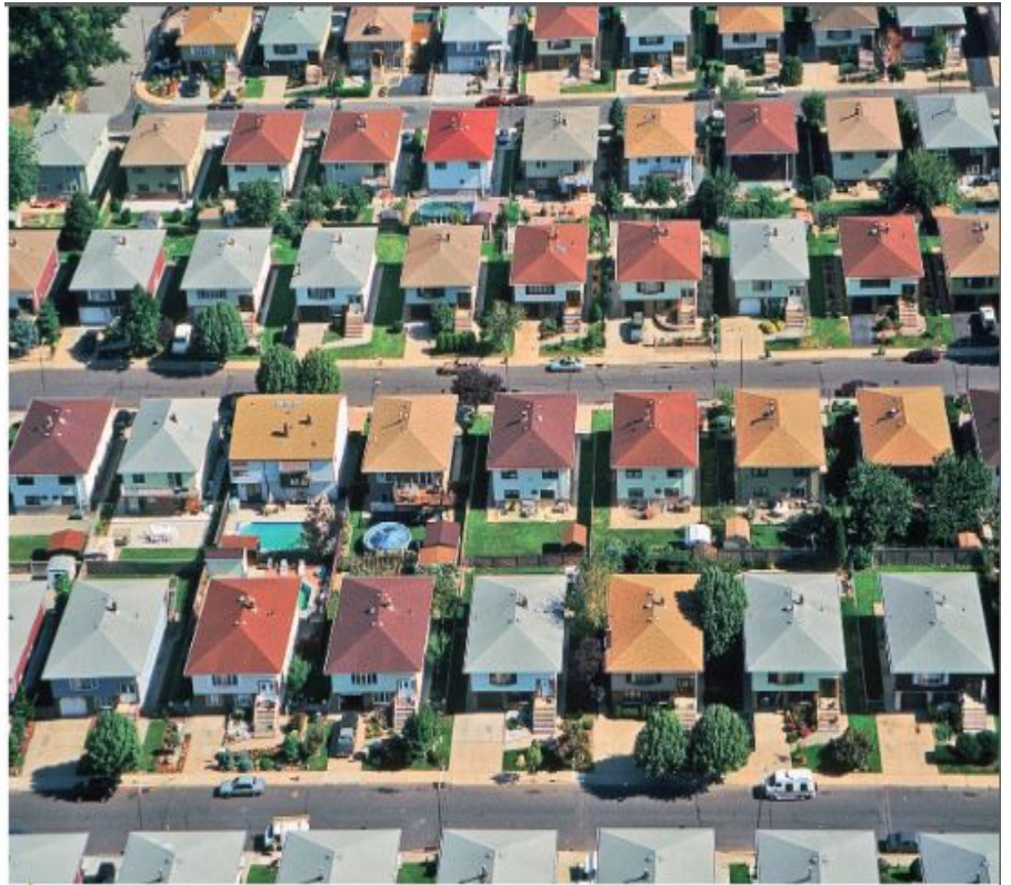
5 Habiter une banlieue pavillonnaire du New Jersey

1. Central business district : le quartier des affaires.