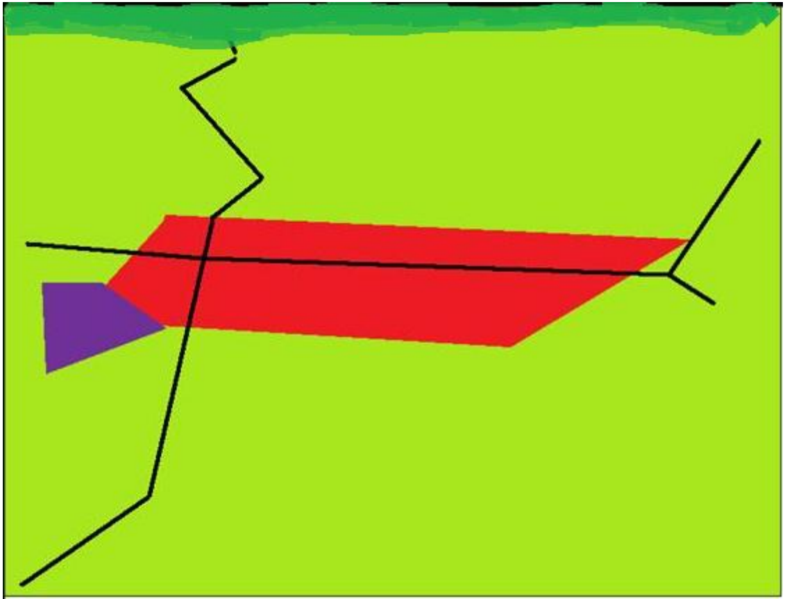
5. Titre : Croquis paysager de Beaugrenier.