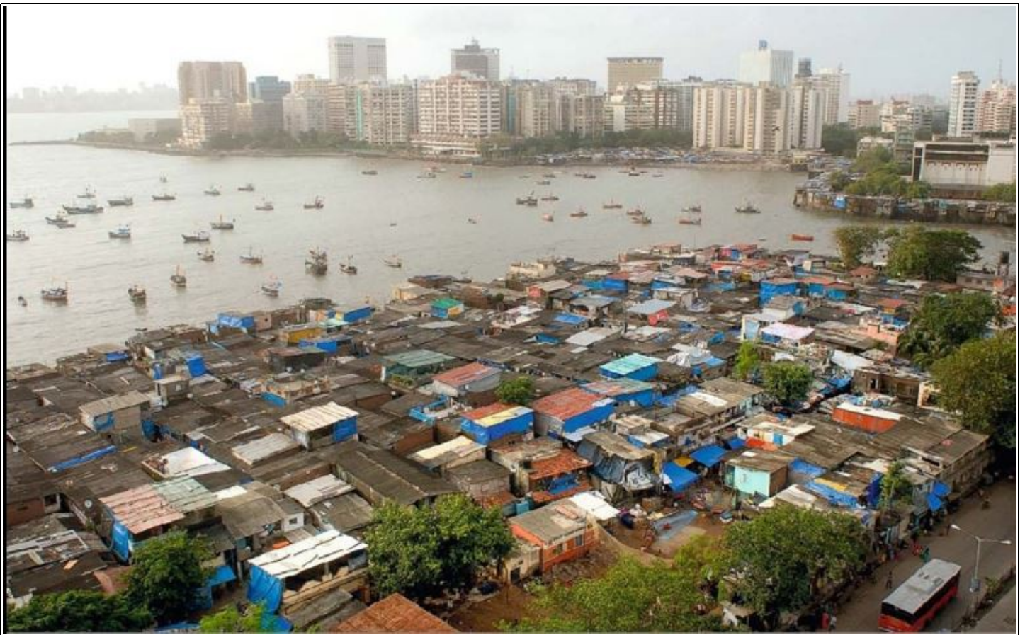
1 Vue de Narinam point, Mumbai