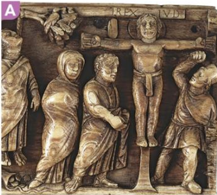
Panneau de coffret en ivoire : La crucifixion de Jésus, V e siècle, British Museum, Londres.

Doc. Les débuts du christianisme (I er -IV e siècles)