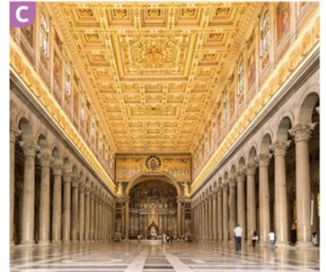
L'intérieur de la basilique Saint-Paul- hors-les-Murs de Rome, construite à la fin du IV e siècle.