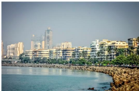
2. Vue sur Nariman Point et la promenade de Marine Drive