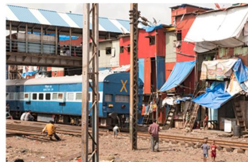
3. La gare ferroviaire de Bandra Est

1) Aidez le fils de la famille Géo à classer ses photos de Mumbai.