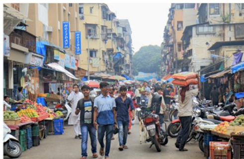
1. Le marché de Sandhurst road

ETAPE 3 : Utilisez vos connaissances pour comprendre un paysage.