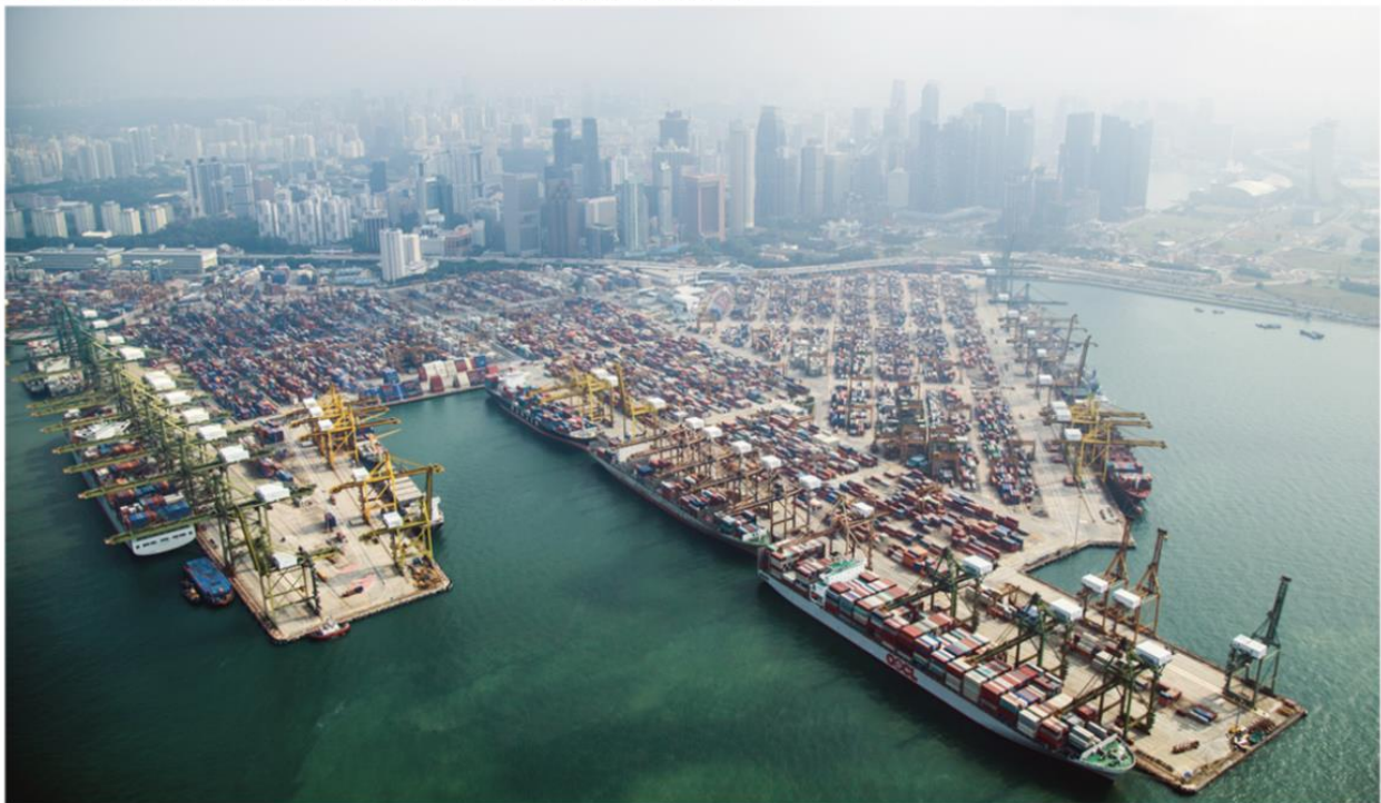
Doc. Terminals de conteneurs, port de Singapour, 2015