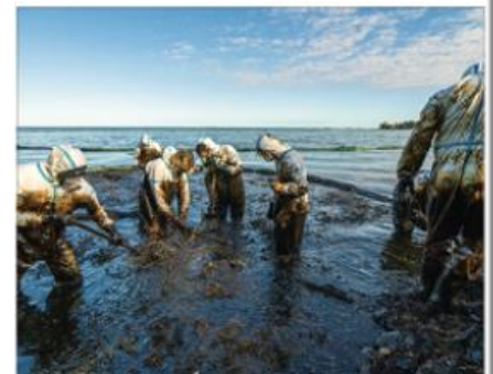
A Littoral pollué et dégradé Marée noire, île Maurice, 2019