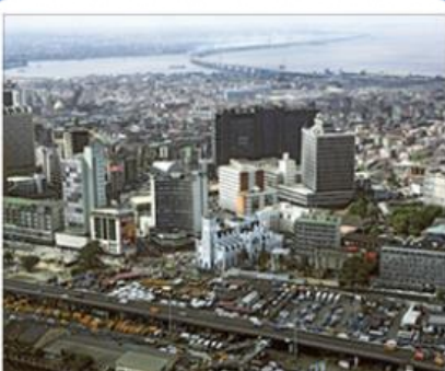
B Littoral urbanisé Lagos, Nigeria