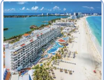
D Littoral touristique Cancún, Mexique