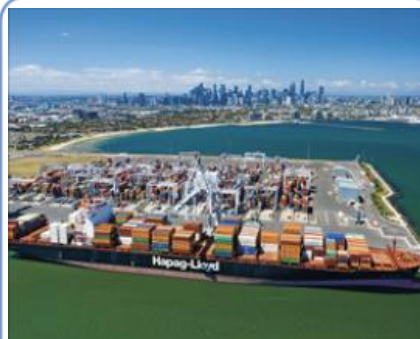
C Littoral industrialo-portuaire Melbourne, Australie