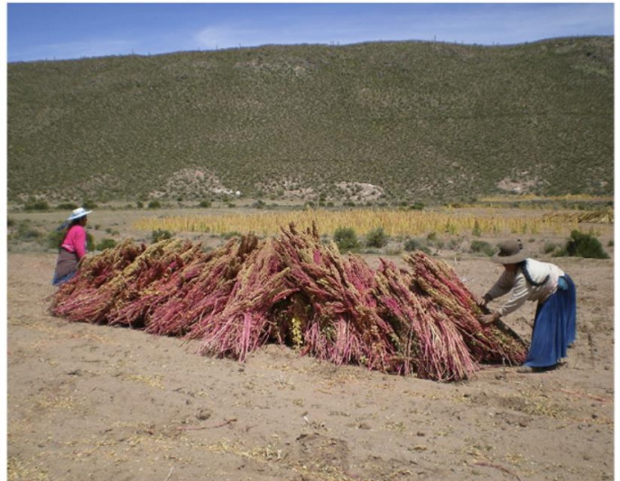
Récolte de quinoa en Bolivie (Amérique du Sud) où les productions équitables se développent pour mieux protéger les revenus des petits producteurs.