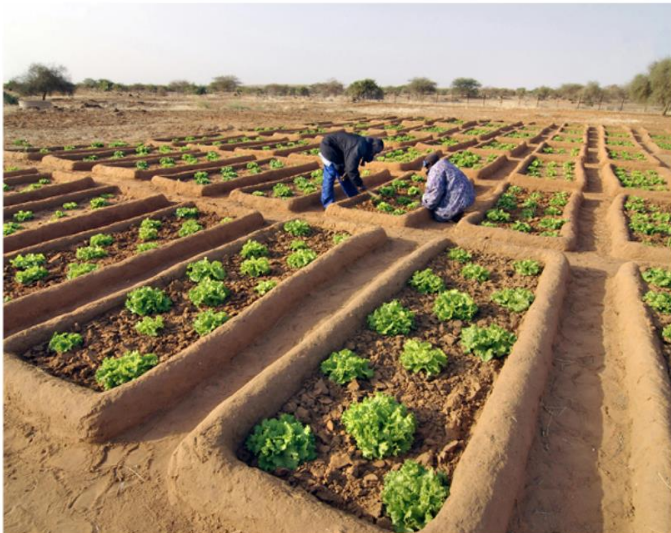
Culture de salades en agroécologie au Mali (Afrique) dans un objectif de plus grand respect de l'environnement.