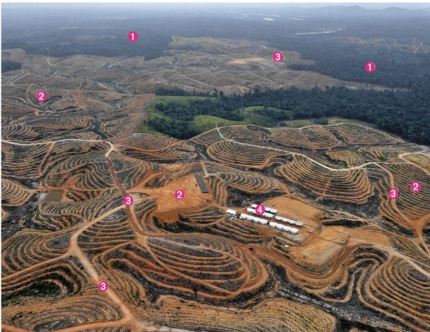
Doc. Aménagement de palmiers à huile sur l'île de Bornéo (Indonésie)