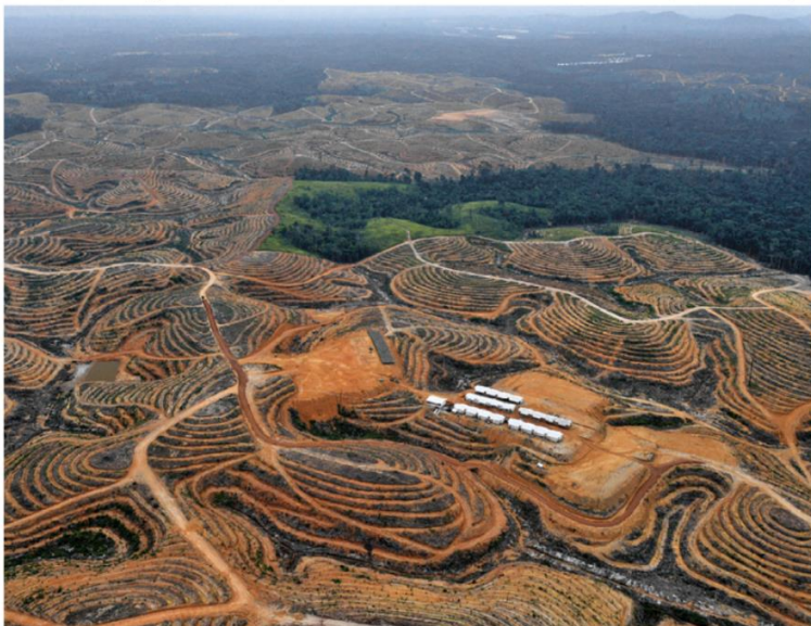
Doc. Aménagement de palmiers à huile sur l'île de Bornéo (Indonésie)