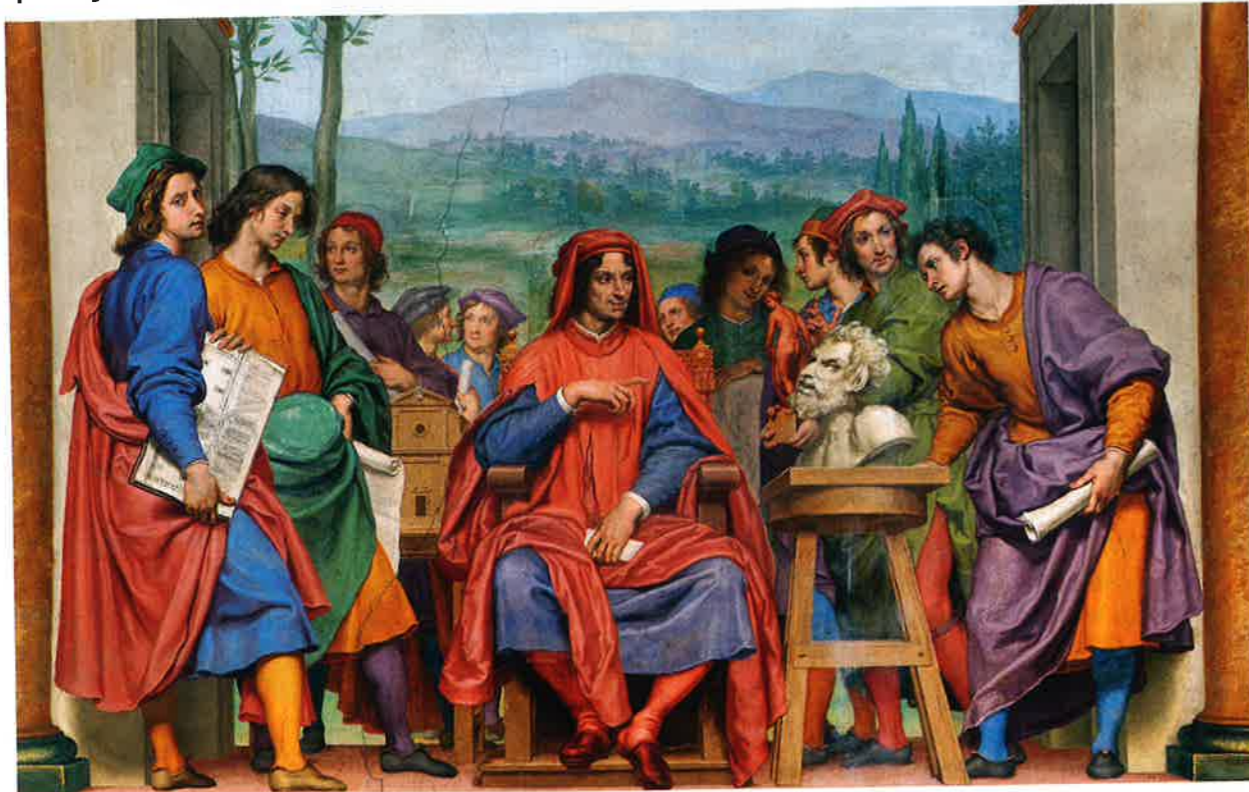
1 Laurent de Médicis, prince de Florence et mécène Ottavio Vannini (1585-1643), fresque, 1635, Palais Pitti, Florence.