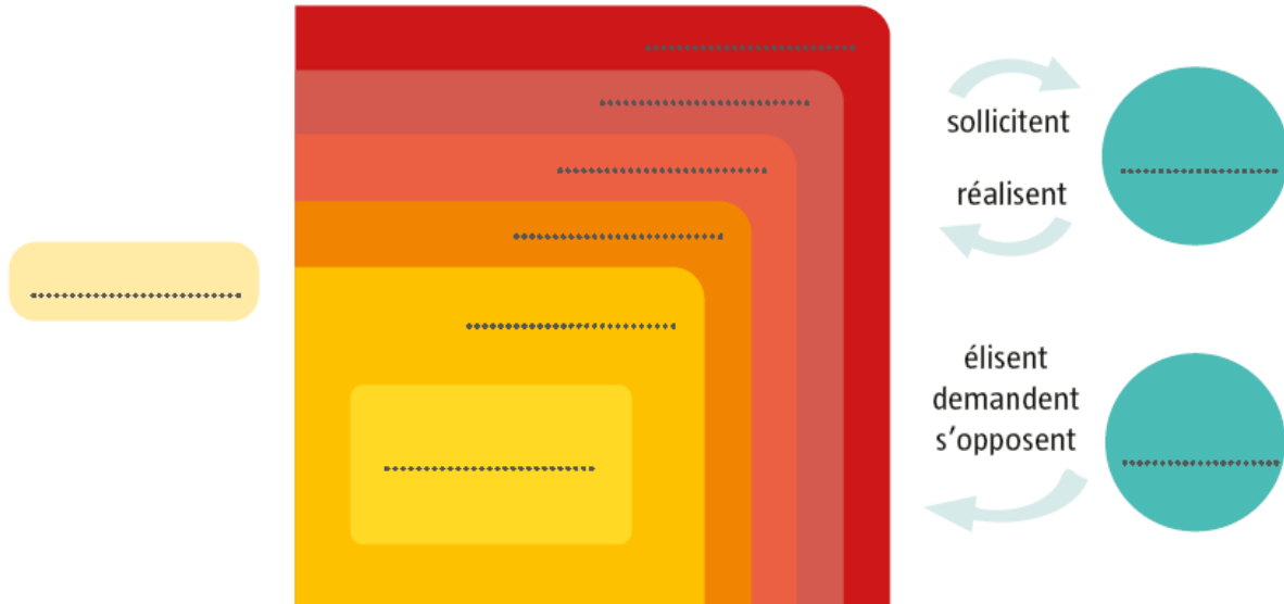
SCHÉMA À COMPLÉTER