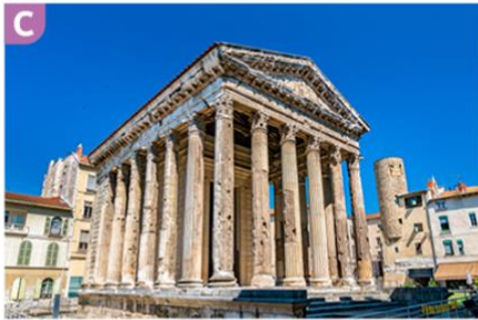
Temple de Vienne