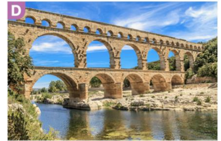
Aqueduc du Pont du Gard, près de Nîmes

1) Reliez chaque photographie à la fonction du monument qu'elle représente.