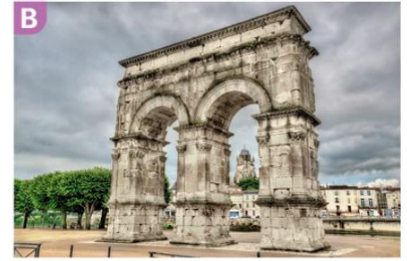
Arc de triomphe de Saintes