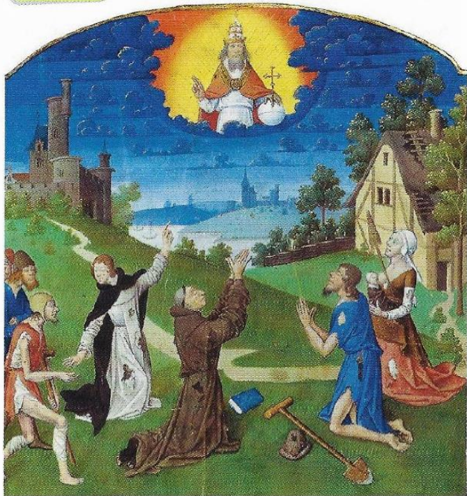
Traité théologique, vers 1490, BNF, Paris.