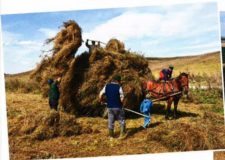
2 Ramassage du foin à Viscri (Roumanie), 2014