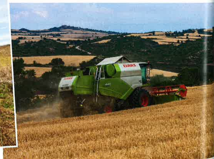
3 Récolte de blé mécanisée à Lérida (Espagne), 2014