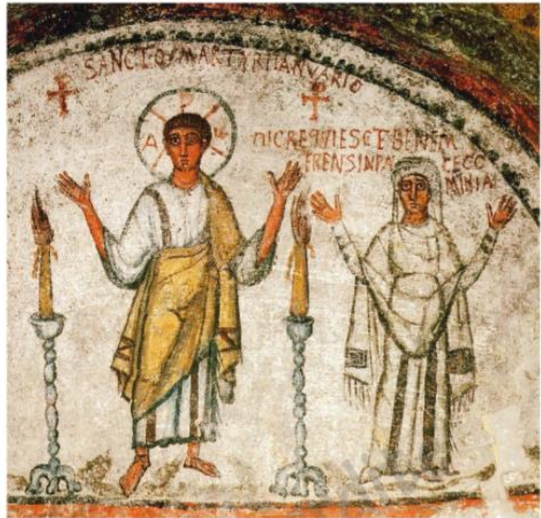
5 Des chrétiens en prière (Catacombes de San Gennaro, Italie, V e siècle.) Les chrétiens prient plusieurs fois par jour.

■ Pline (gouverneur romain de Bithynie) à l'empereur Trajan, Lettres 97 et 98 sur les chrétiens , vers 112 après J.-C.