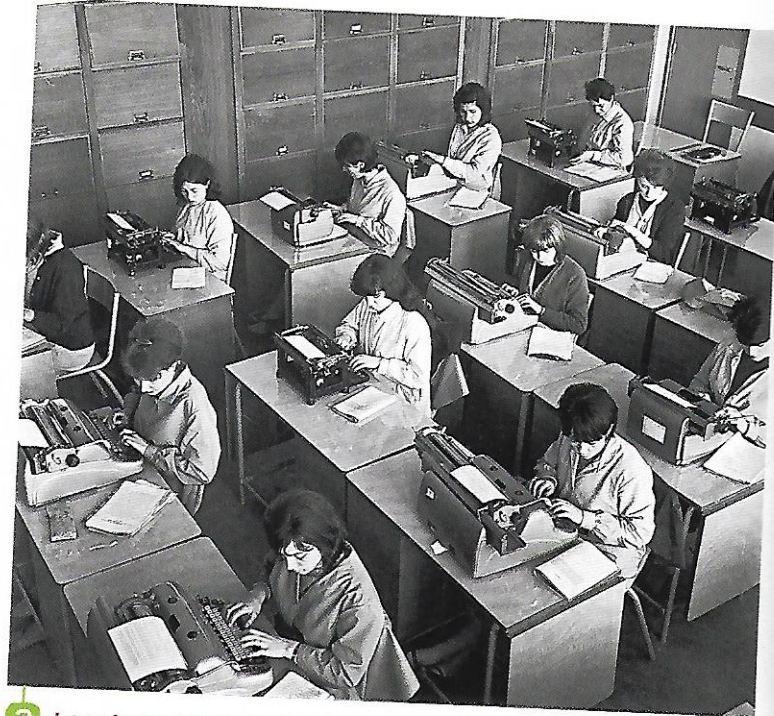
2 Les dactylos de la Poste (Maison des PTT, Arcueil, 1964.)

1983 Loi Roudy sur l'égalité professionnelle entre hommes et femmes.