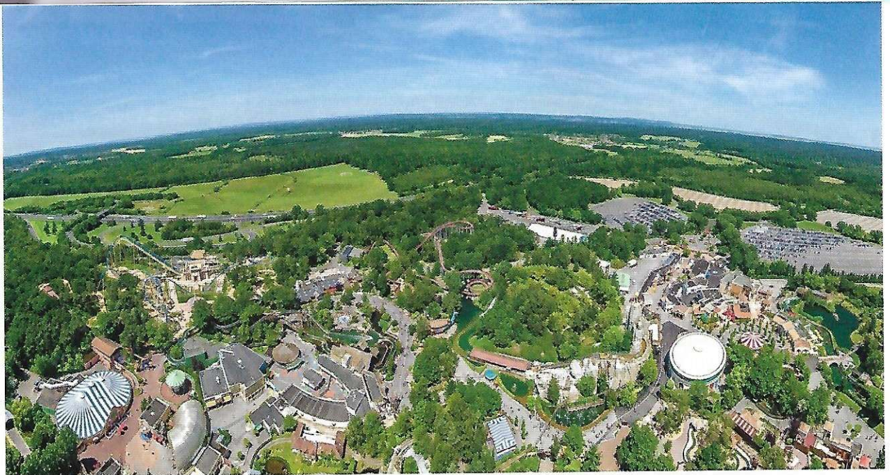
4 Une campagne périurbaine mise en valeur par le tourisme, 2015