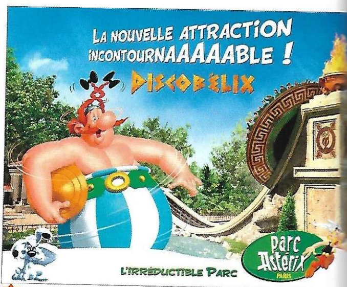
3 Affiche réalisée pour la promotion du parc Astérix, 2016

Le parc mène une politique de communication et d'investissement soutenue pour innover et rester compétitif face à la concurrence.