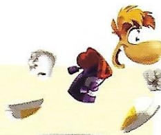
Rayman, personnage créé par Ubisoft.