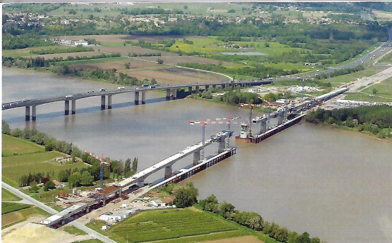
4 Un viaduc en construction près de Bordeaux pour le passage des TGV, 2014