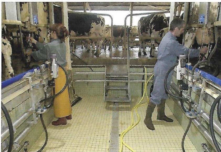
1 Une exploitation laitière en Basse-Normandie (Manche), 2014

Question clé Comment la mondialisation fait-elle évoluer les espaces de production laitière du Grand Ouest ?