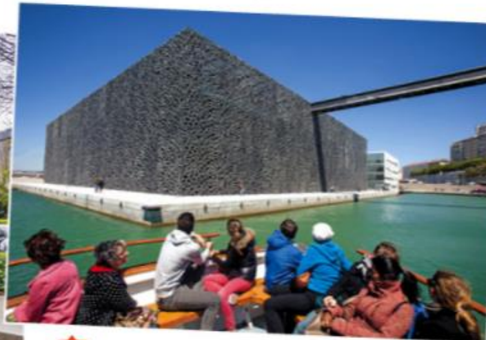
4 Musée des Civilisations de l'Europe et de la Méditerranée (Marseille), 2013