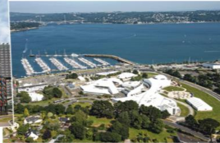
2 Océanopolis, le parc de découverte des océans à Brest, 2015