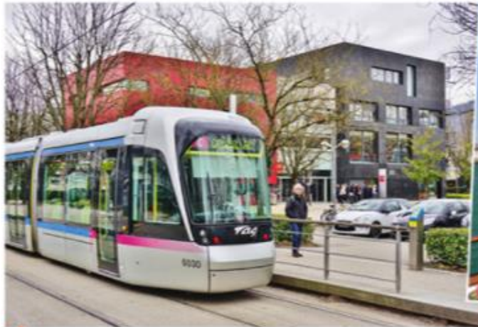
3 Le campus universitaire de Grenoble, 2015