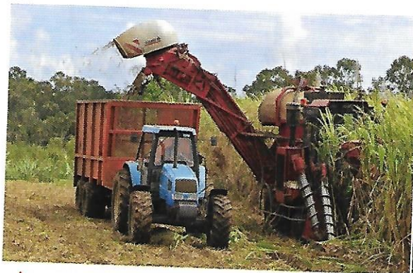
3 Récolte mécanisée de la canne à sucre (La Réunion), 2015