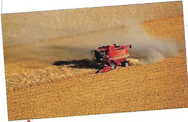
1 Moisson d'un champ de blé dans la Beauce, 2014

D'après la carte p. 236, à quel type d'espace agricole chacun de ces paysages correspond-il ?