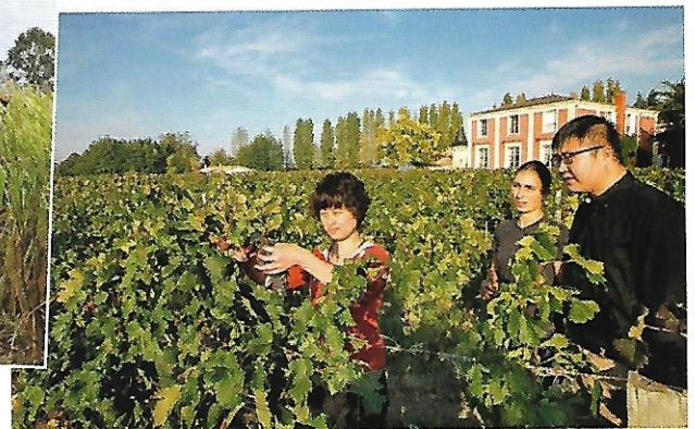
4 Un propriétaire chinois inspecte ses vignes, Château de Viaud (Gironde), 2014