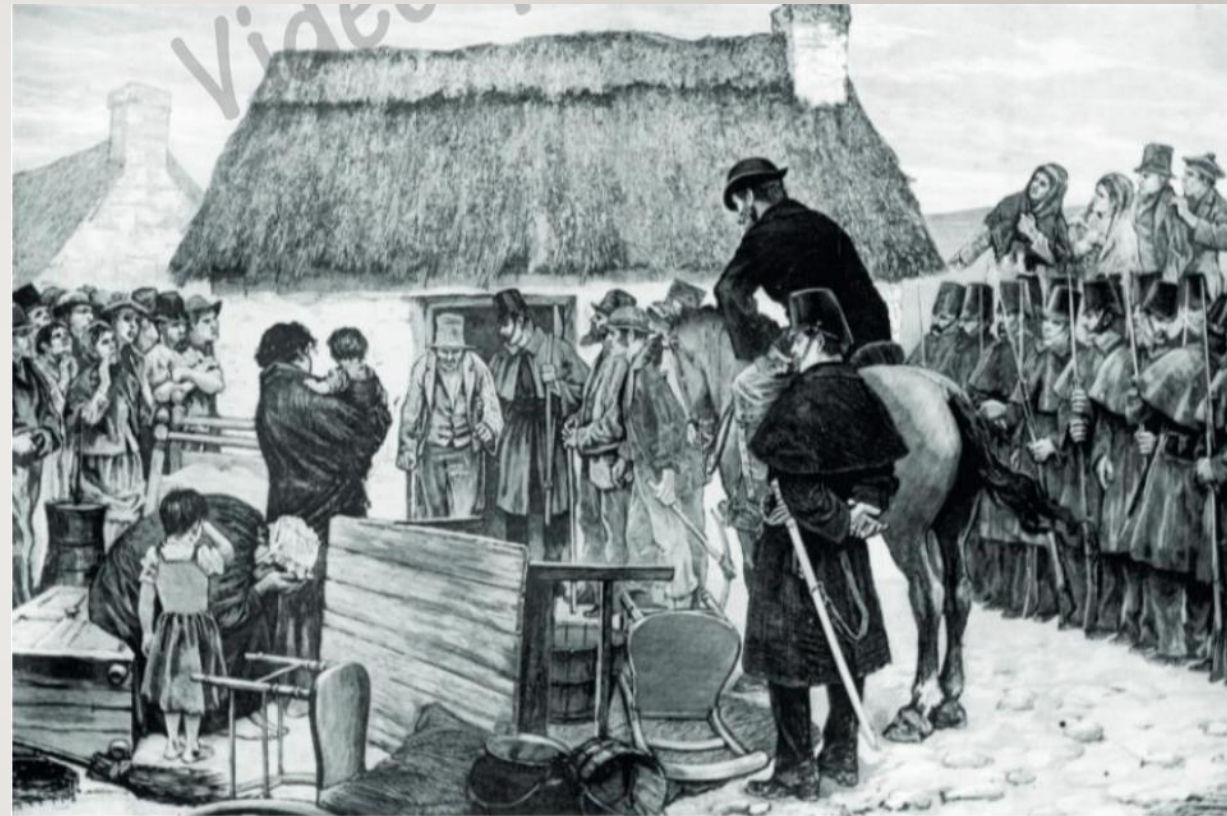
Gravure de Tomas Carlos Capuz

L'expulsion des fermiers irlandais par les propriétaires protégés par la police est un thème classique, souvent illustré par les journaux.