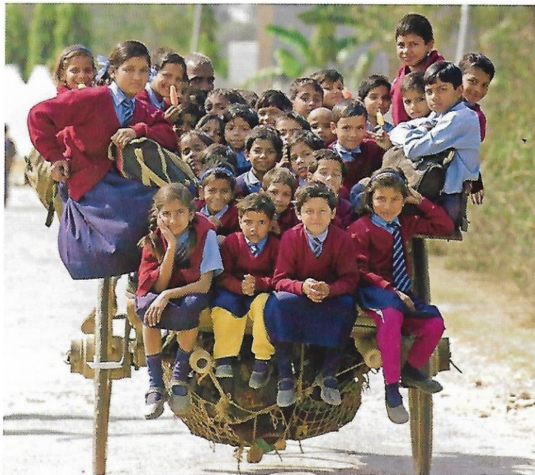
1 Des enfants indiens sur le chemin de l'école en rickshaw (New Delhi)

Comment la population indienne évolue-t-elle ? Comment répondre à ses besoins ?