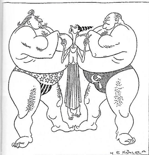
Europa „Verderben Sie sich's nicht ganz mit mir, meine Herren – ich besinne mich eben, ob ich nicht doch die dritte Kraft werde...“