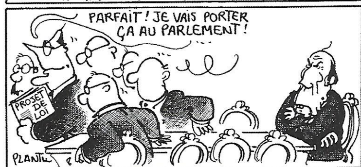
6 Dessin du 10 novembre 1986 à la « Une » du journal Le Monde (Caricature de Plantu.)