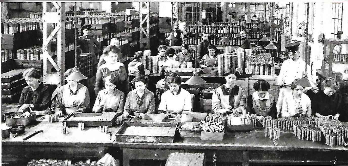
4 La mobilisation de l'arrière Ouvrières allemandes dans une usine de munitions, 1916.