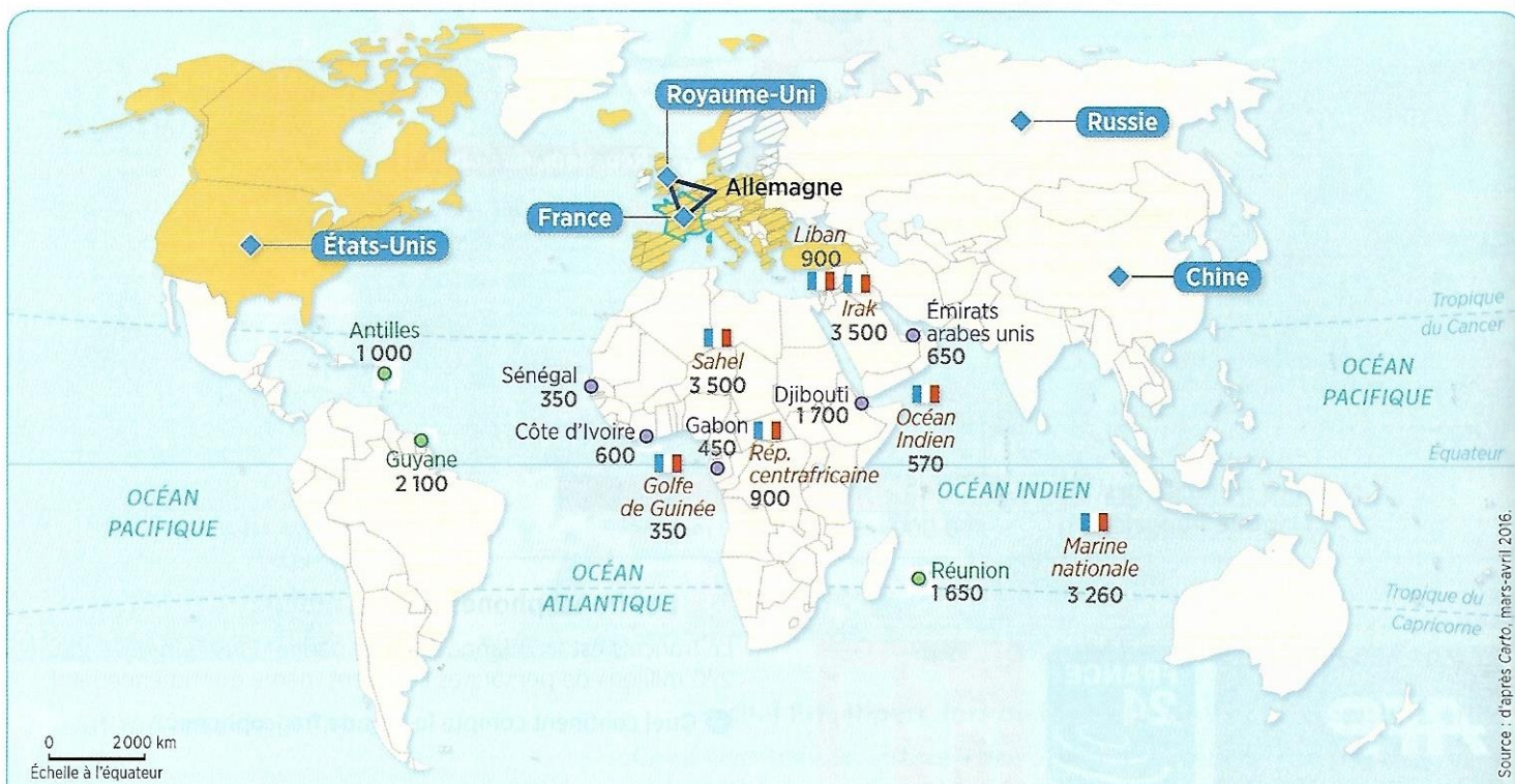
Source : d'après Carto, mars-avril 2016.

❖ La France a-t-elle encore une influence mondiale ?