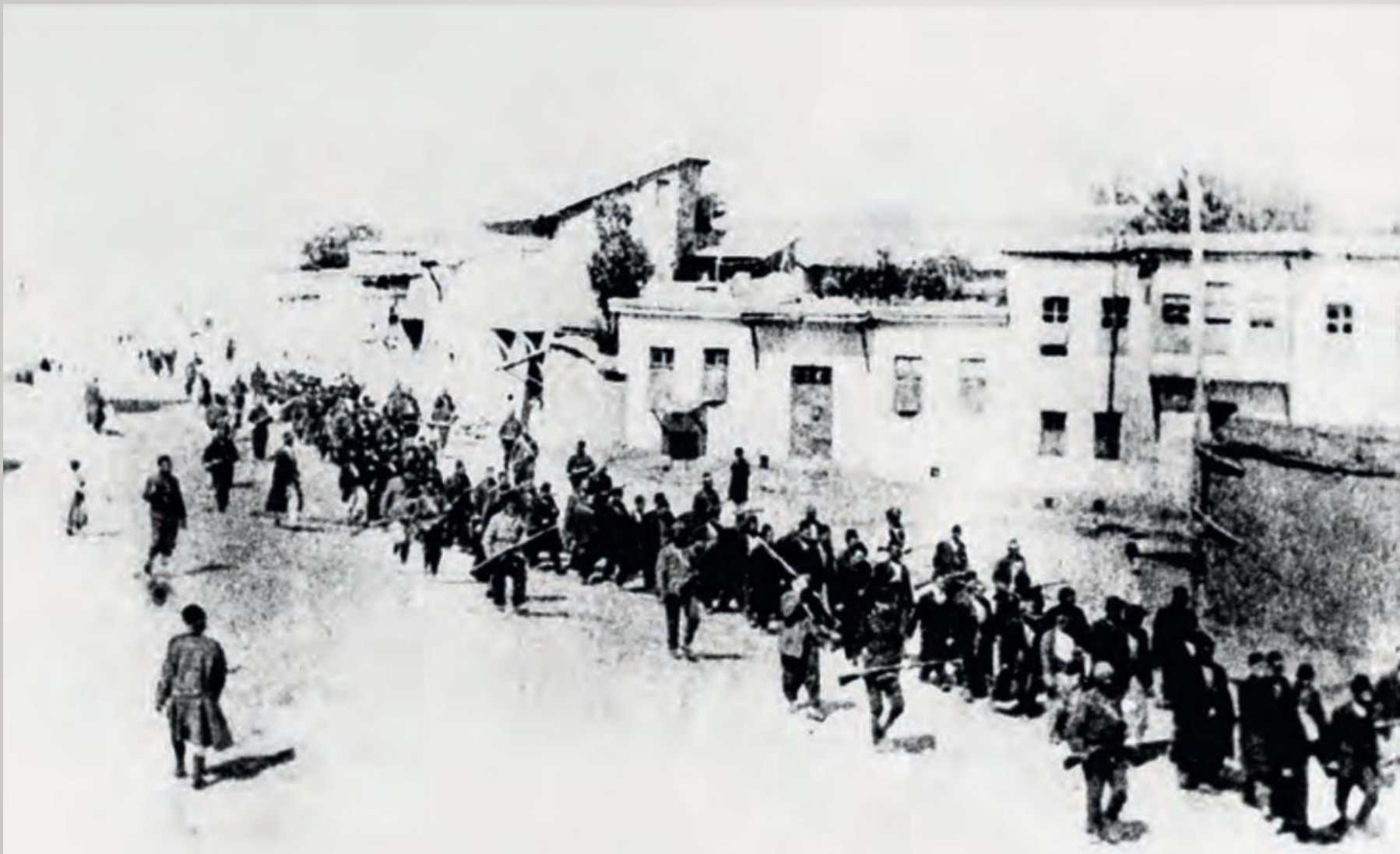
Photographie d'Arméniens encadrés par des soldats pendant leur déportation à Kharput, mai-juin 1915