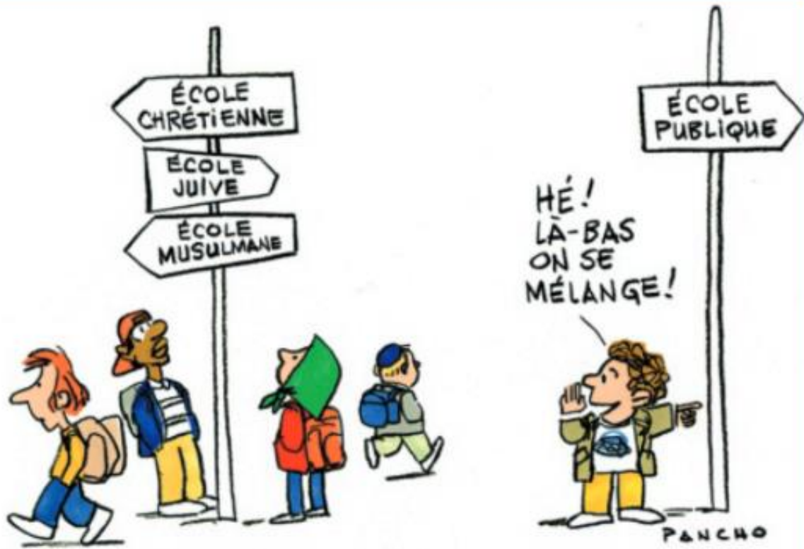
Caricature de Pancho, 2013.