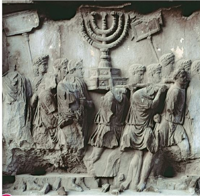
3 Les relations entre les Juifs et les Romains se dégradent À Jérusalem, en 70, le second Temple est détruit par les Romains qui le pillent et emportent la menorah. De nombreux Juifs sont massacrés. Bas-relief de l'arc de Titus, élevé à Rome en 81.