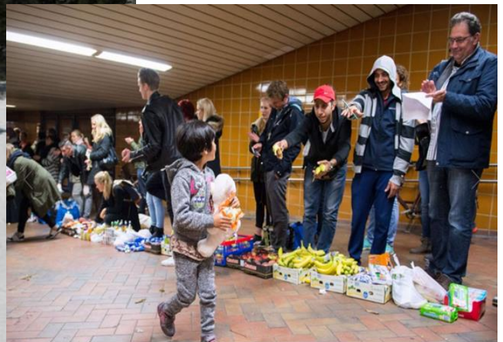
Distribution de nourriture et de boissons aux migrants en gare de Hambourg en septembre 2015 Doc 13

■ D'après Catherine Wihtol de Wenden, Atlas des migrations , Éditions Autrement, 2014.