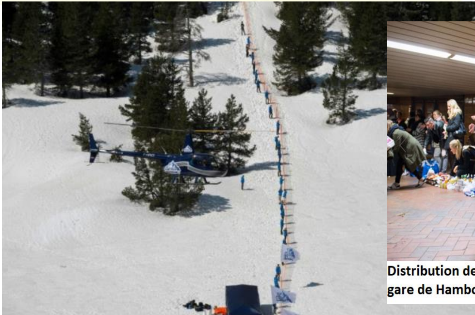
Des activistes du groupe d'extrême droite Génération identitaire dressent une barrière au Col de l'Echelle, dans les Hautes-Alpes, le 21 avril 2018, pour bloquer cet accès emprunté parfois par des migrants venus d'Italie.

1. Communauté haïtienne vivant à l'étranger.