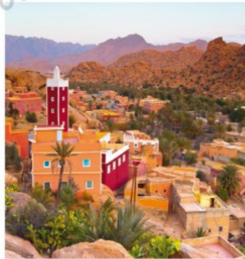
3 Un village marocain transformé par les migrations De nombreux habitants de la vallée de Tafraout (dans l'anti-Atlas marocain) ont émigré vers l'Europe. Leur argent a permis de rénover les habitations et les monuments des villages, comme ici à Adai.

• Olfa Khamira, « Généreuse diaspora : Les transferts d'argent des migrants vers le Maghreb en hausse », www.huffpostmaghreb.com , 28 novembre 2013.