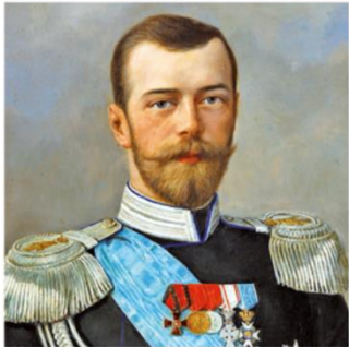
Tsar de l'Empire russe jusqu'en 1917

Habitants de Petrograd et soldats – Lénine – Nicolas II – Rosa Luxemburg