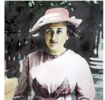
Militante spartakiste qui souhaite étendre la révolution en Allemagne en 1918