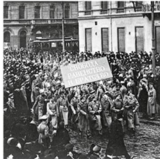
Les manifestants qui chassent le tsar en février 1917