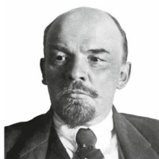
Avec les bolcheviks, il s'empare du pouvoir en novembre 1917