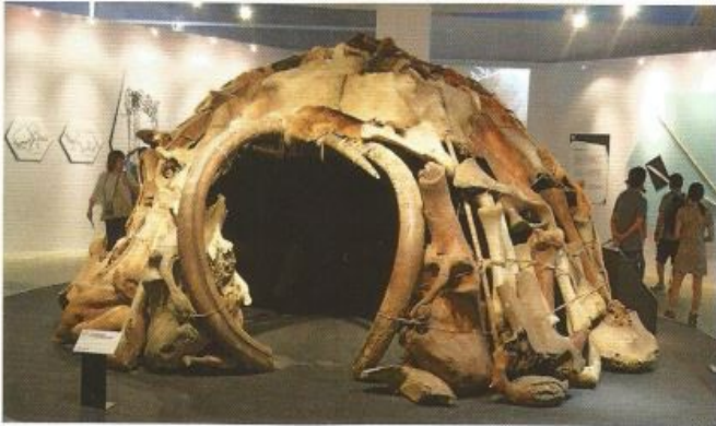
1 Reconstitution d'une hutte en os de mammoth