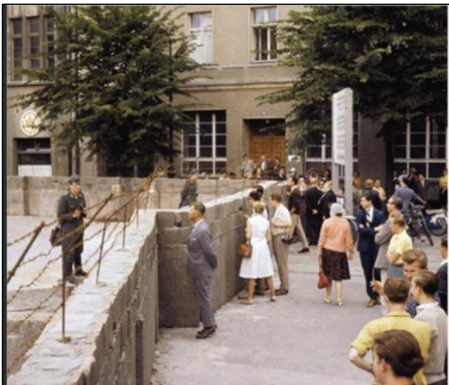
2 La construction du mur de Berlin (1961)