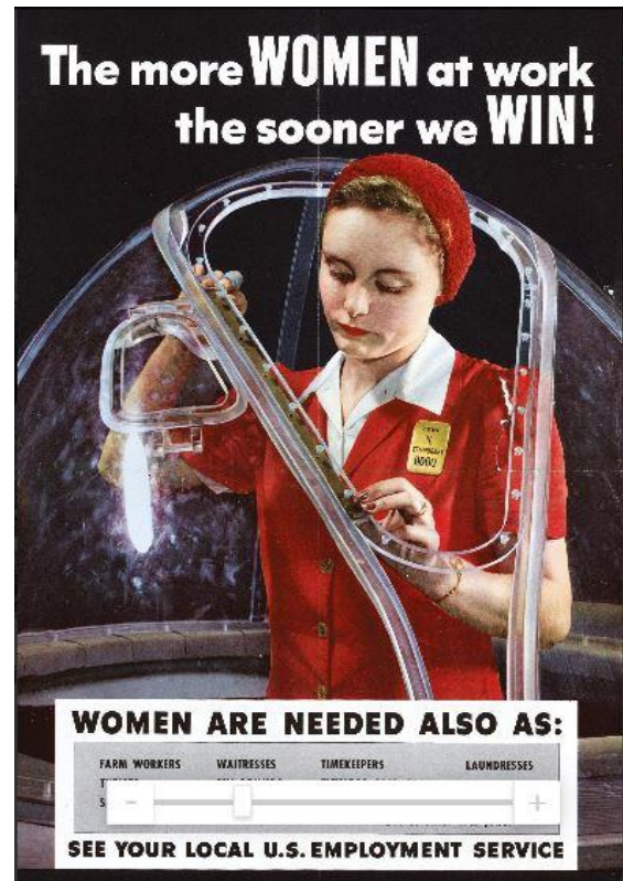
« Avec plus de femmes au travail, nous gagnerons plus vite », affiche américaine en faveur du travail des femmes dans les usines d'aviation, 1943 (Livre scolaire)