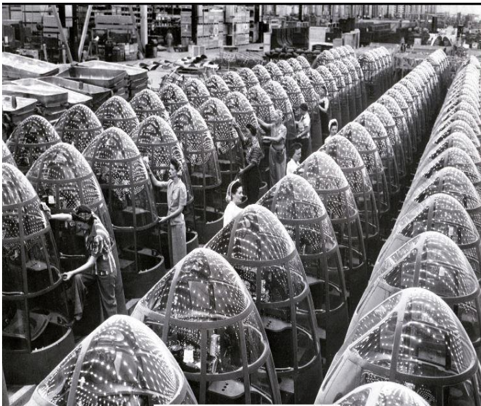
Usine de production de bombardiers en Californie, 1942 (Livre scolaire)