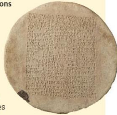
Clou de fondation en argile retrouvé dans le temple de Shamash, dieu du soleil et de la justice, vers 1800 av. J.-C. Musée du Louvre, Paris.