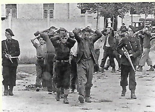
Des miliciens du régime de Vichy arrêtent des hommes soupçonnés d'appartenir à la Résistance en 1943.

1. Par la Gestapo (police politique allemande).