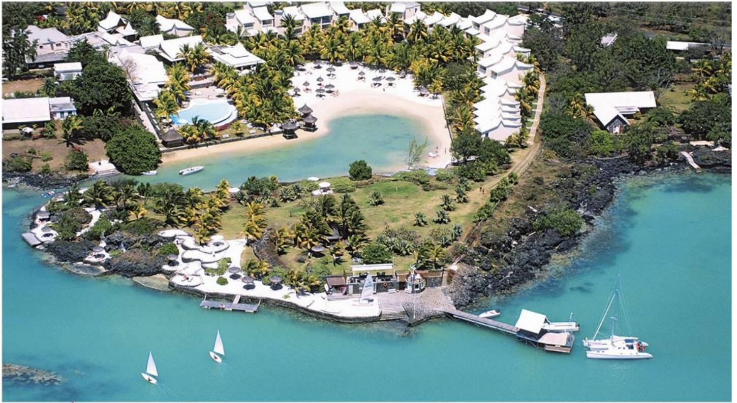
3 Le complexe hôtelier de Paradise Cove (2014)