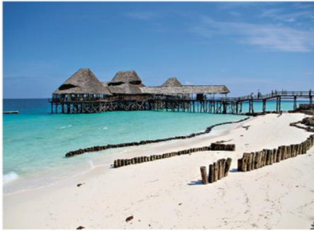
❶ Le Flamingo Bay Water Lodge au Mozambique