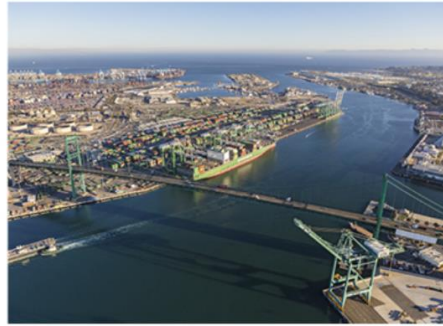
❷ Le port de Los Angeles