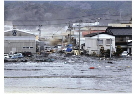
❸ Tsunami au Japon en 2011

1) Quel espace géographique suis-je ? Identifiez les repères décrits par les propositions suivantes :