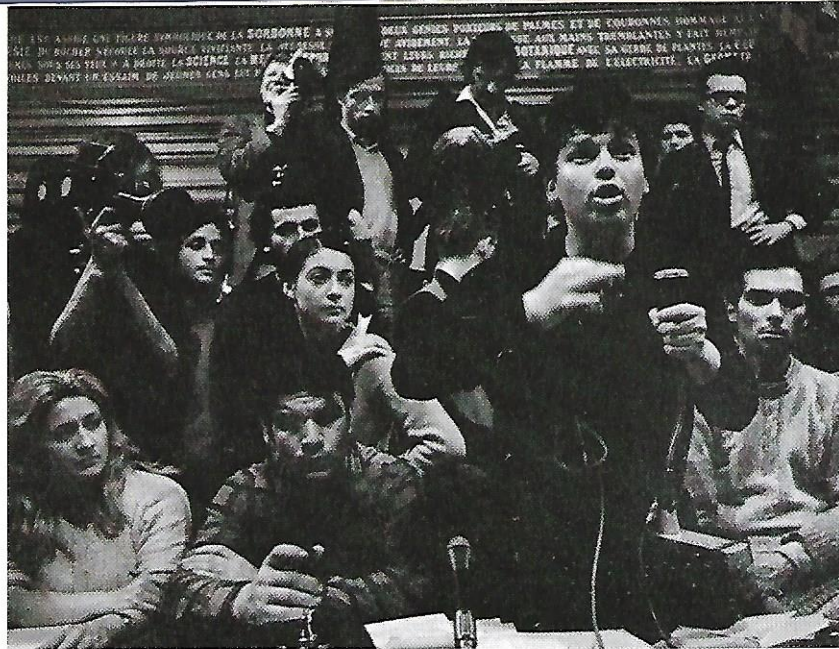
3 Daniel Cohn-Bendit, leader étudiant de 22 ans, lors d'un débat à la Sorbonne